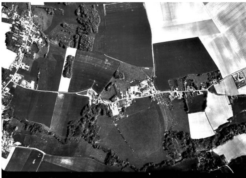
En 1973 les travaux de déviation ont commencé

Seule la largeur obligatoire d'1,50m est recouverte de bitume. Il reste donc des espaces plus ou moins larges, qui seront remis en terre. Pour faciliter leur entretien, des plantes couvrantes type corbeille d'argent ou du millepertuis seront mises.