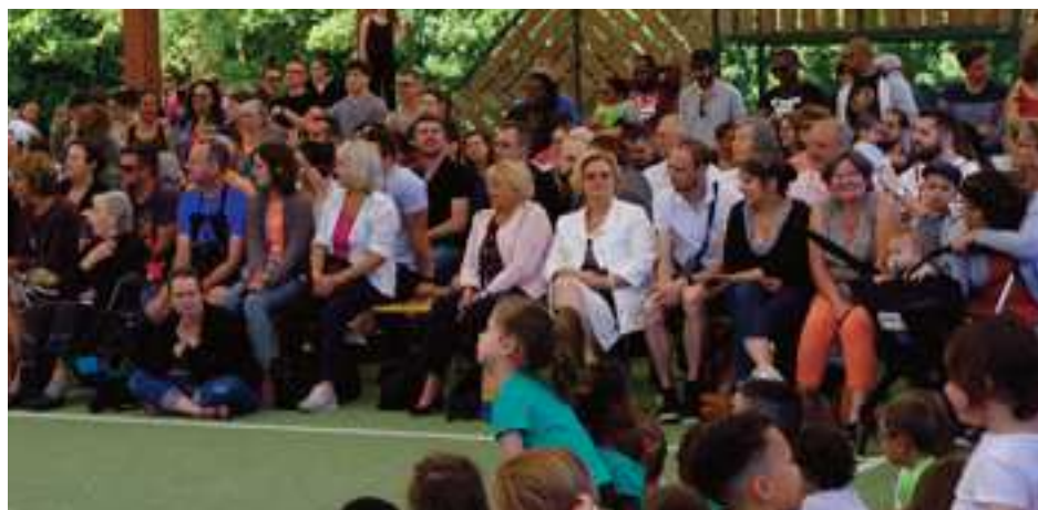
Une partie de la nombreuse assistance

fants étaient contents de se produire devant eux. Un petit moment d'émotion à la fin quand le directeur nous a fait part de sa mutation à la prochaine rentrée dans un nouvel établissement.