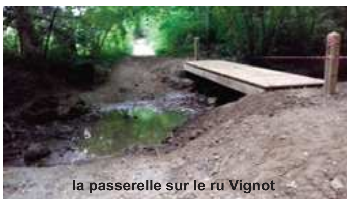
la passerelle sur le ru Vignot