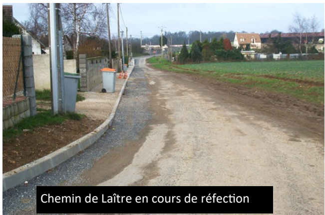
Chemin de Laître en cours de réfection