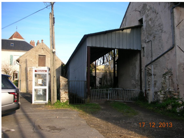
Vue de la place du Monument aux morts en 2013

Cette place a servi longtemps de parking, masquant le monument aux morts