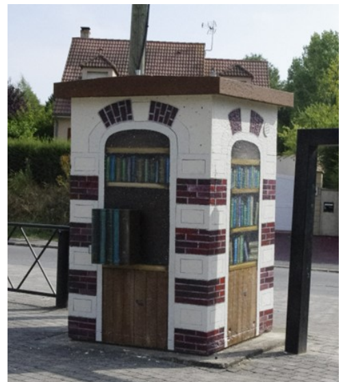
Trompe l'œil rue du Mont (le 1er des 6 réalisés)