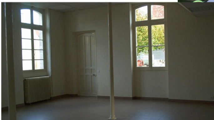
Salle de classe puis salle de cantine puis salle multi-activités avant d'en faire l'accueil de la mairie rendue accessible.