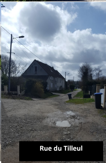
Rue du Tilleul