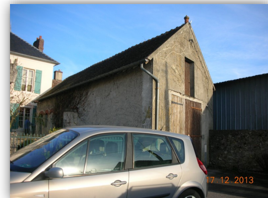
Avant enlèvement des tôles

COÛT DE L'OPERATION réalisée en 2019 et terminée en 2020 : 410 950 €