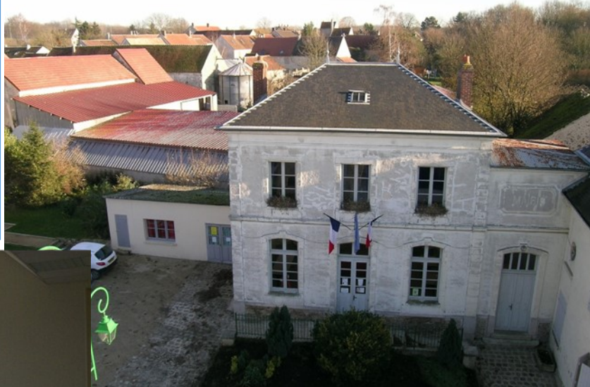
Ravalement de la façade, changement des linteaux...