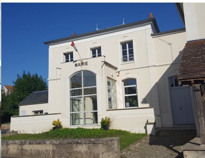
Inauguration en janvier 2013 par la Préfète Nicole KLEIN