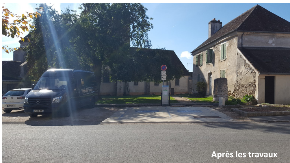
Après les travaux

Le presbytère en 2004 avant de modifier et embellir les abords de l'église.